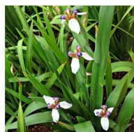
Íris-da-praia Neomarica candida