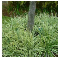
Barba-de-serpente Ophiopogon jaburan