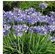
Agapanto Agapanthus africanus