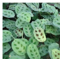
Maranta-pena-de-pavão Maranta leuconeura