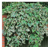
Hera variegata Hedera canariensis 'variegata'