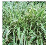
Dianela Dianella tasmanica