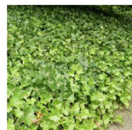
Hera Hedera canariensis