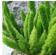
Aspargo-rabo-de-gato Asparagus densiflorus