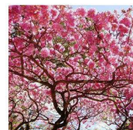
Ipê Roxo Tabebuia avellanedae