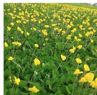
Gramma-amendoim Arachis repens