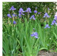
Falso-iris Neomarica caerulea