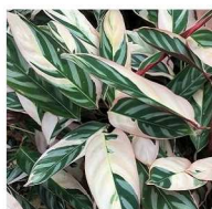
Maranta-variegata Ctenanthe oppenheimiana