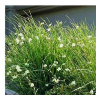
Moréia-bicolor Dietes bicolor