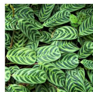
Maranta-cinza Ctenanthe setosa