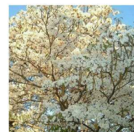
Ipê Branco Tabebuia roseo-alba