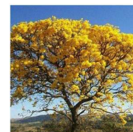
Ipê Amarelo Tabebuia chrysotricha